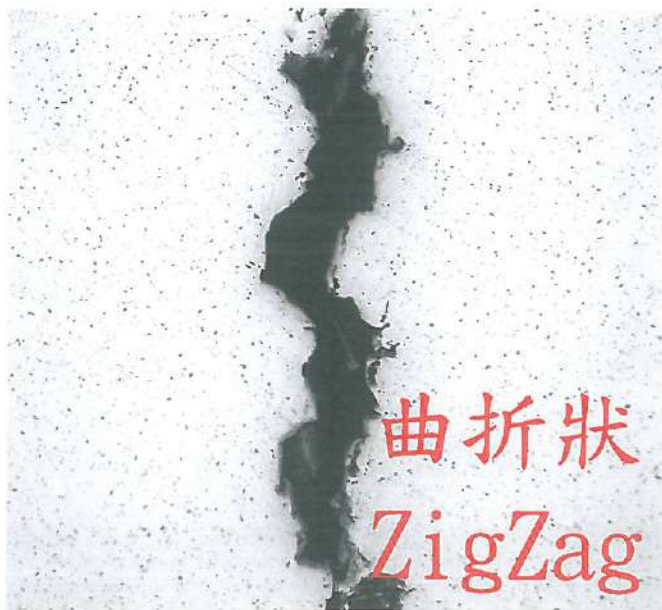
圖(3) 開裂樣品金相橫切面 200X