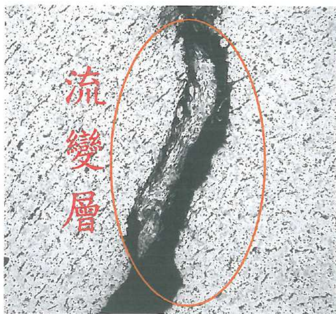
圖(4) 開裂樣品金相橫切面 200X Picral